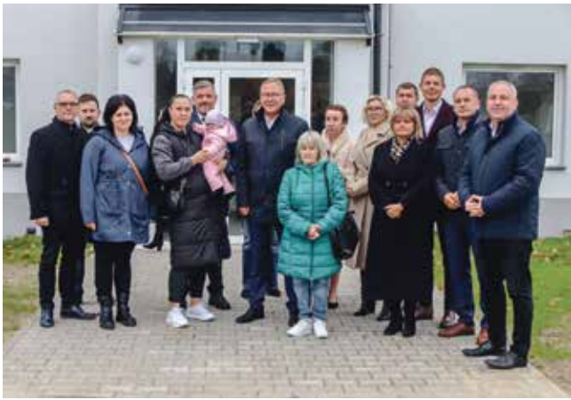
Nowy blok na Piastów