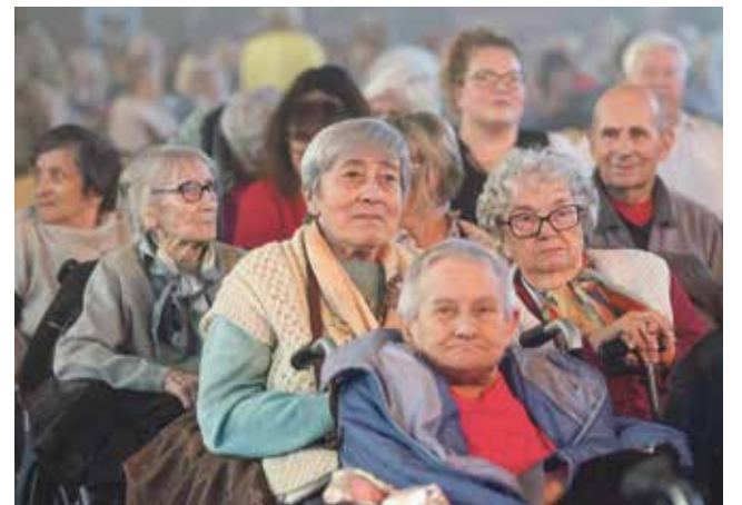
Starogardzki Dzień Seniora