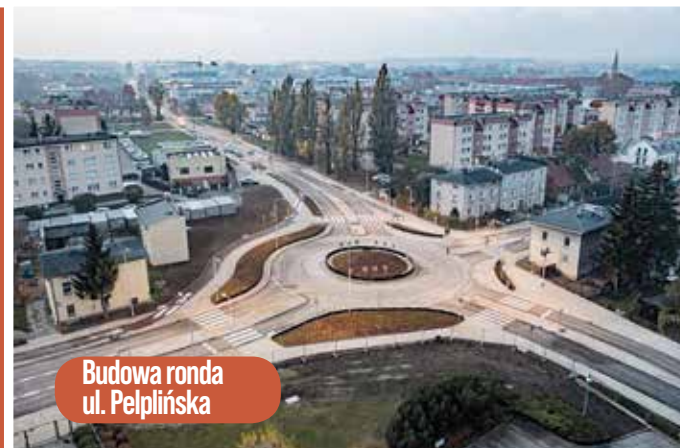
Budowa ronda ul. Pelplińska

Budowa i modernizacja dróg 43 161 657 zł dofinansowanie 17 071 740 zł