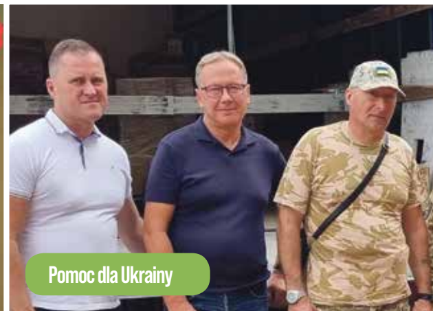
Pomoc dla Ukrainy