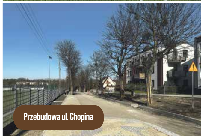
Przebudowa ul. Chopina