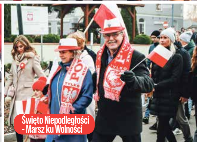
Święto Niepodległości - Marsz ku Wolności