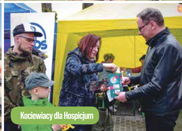
Kociwiacy dla Hospicjum