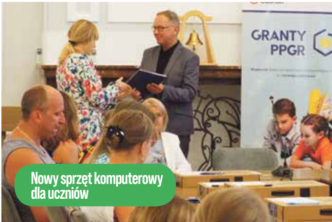
Nowy sprzęt komputerowy dla uczniów