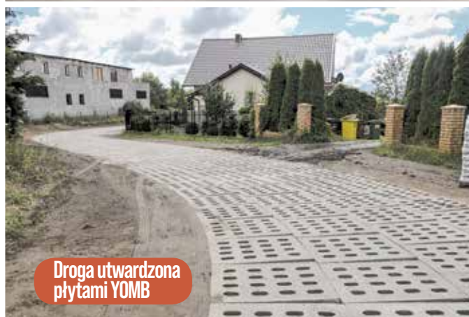
Droga utwardzona płytami YOMB