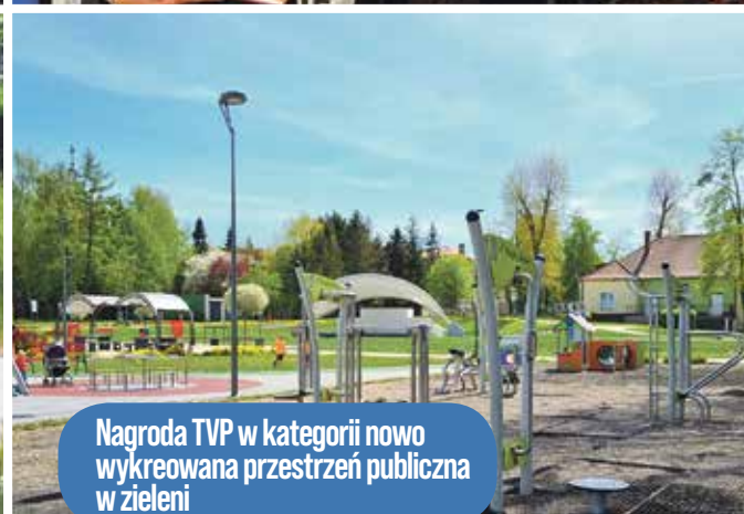
Nagroda TVP w kategorii nowo wykreowana przestrzeń publiczna w zieleni