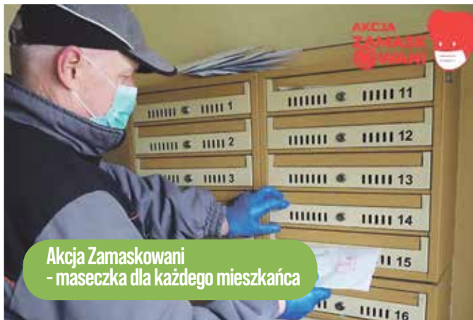
Akcja Zamaskowani - maseczka dla każdego mieszkańca