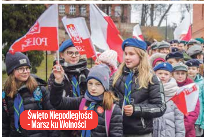
Święto Niepodległości - Marsz ku Wolności