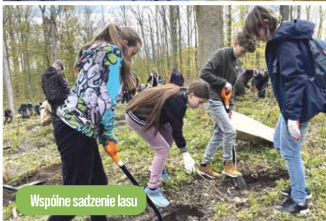
Wspólne sadzenie lasu