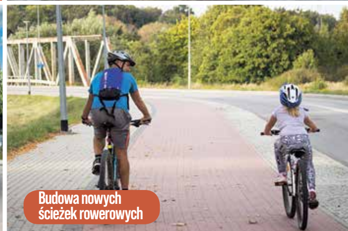
Budowa nowych ścieżek rowerowych