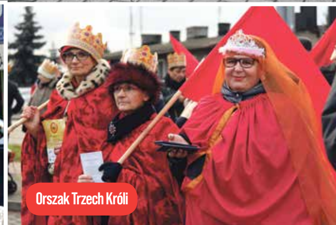
Orszak Trzech Króli