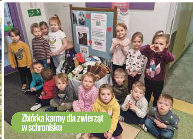
Zbiórka karmy dla zwierząt w schronisku