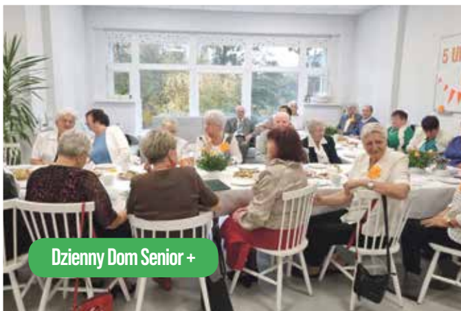
Dzienny Dom Senior +