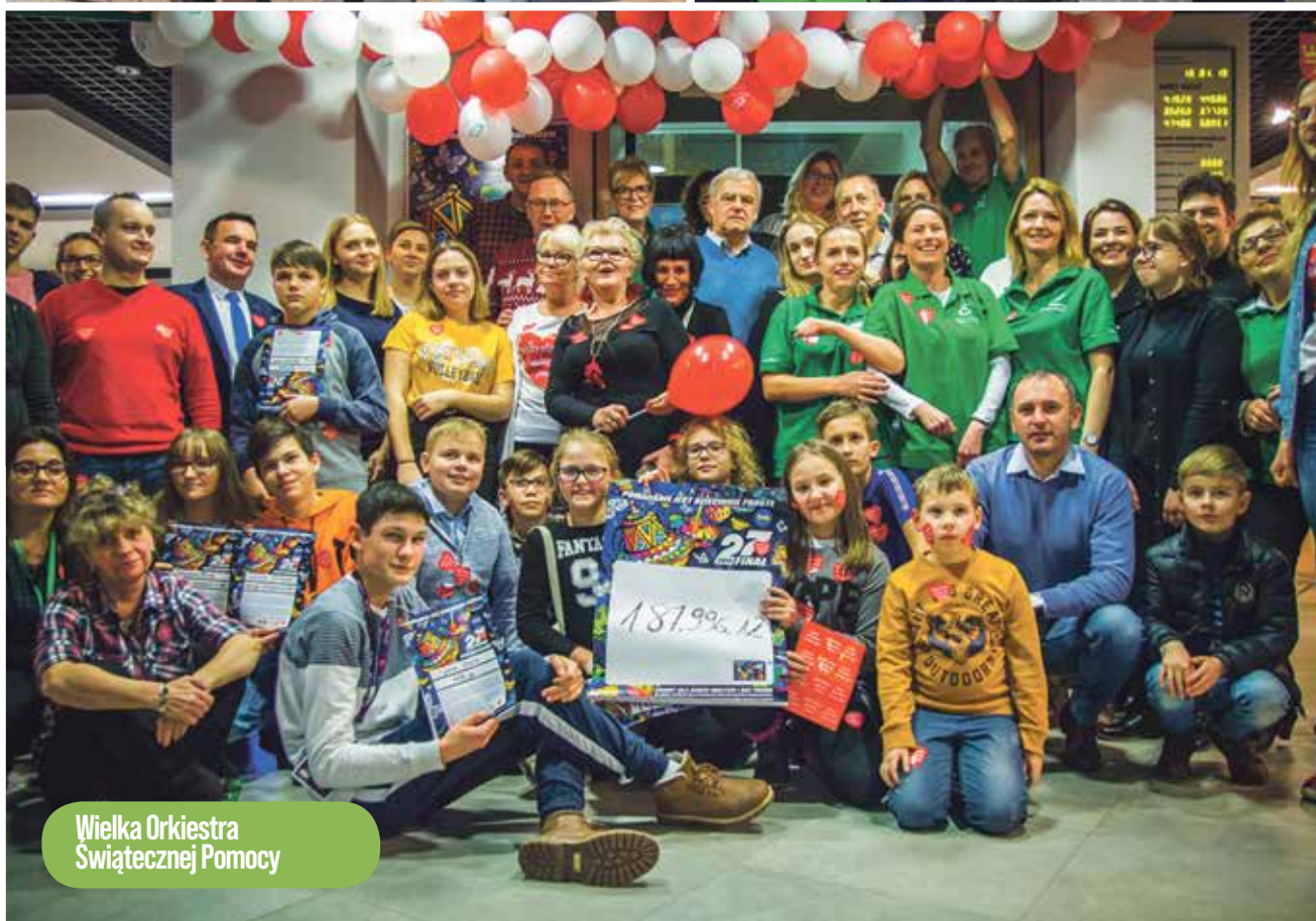
Wielka Orkiestra Świątecznej Pomocy