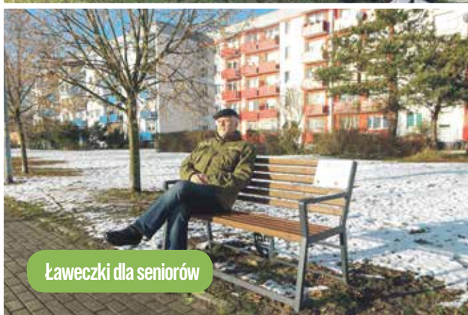
Ławeczki dla seniorów