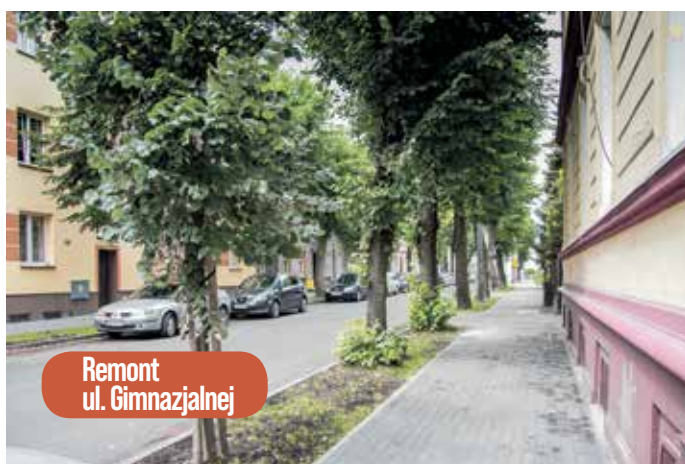
Remont ul. Gimnazjalnej