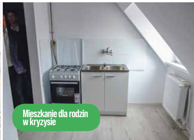
Mieszkanie dla rodzin w kryzysie