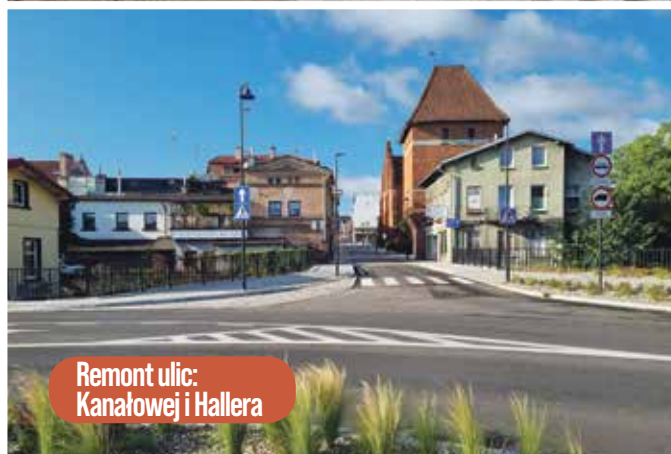
Remont ulic: Kanałowej i Hallera