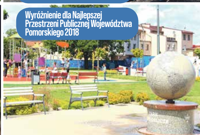
Wyróżnienie dla Najlepszej Przestrzeni Publicznej Województwa Pomorskiego 2018