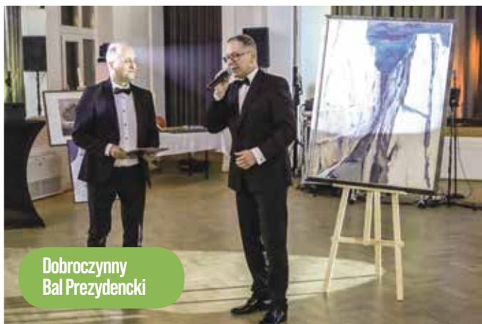
Dobroczynny Bal Prezydencki