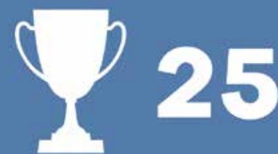
NAGRÓD DLA MIASTA I PREZYDENTA MIASTA