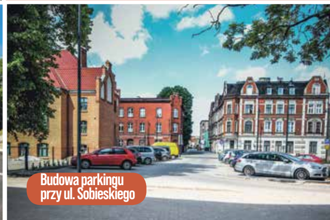
Budowa parkingu przy ul. Sobieskiego