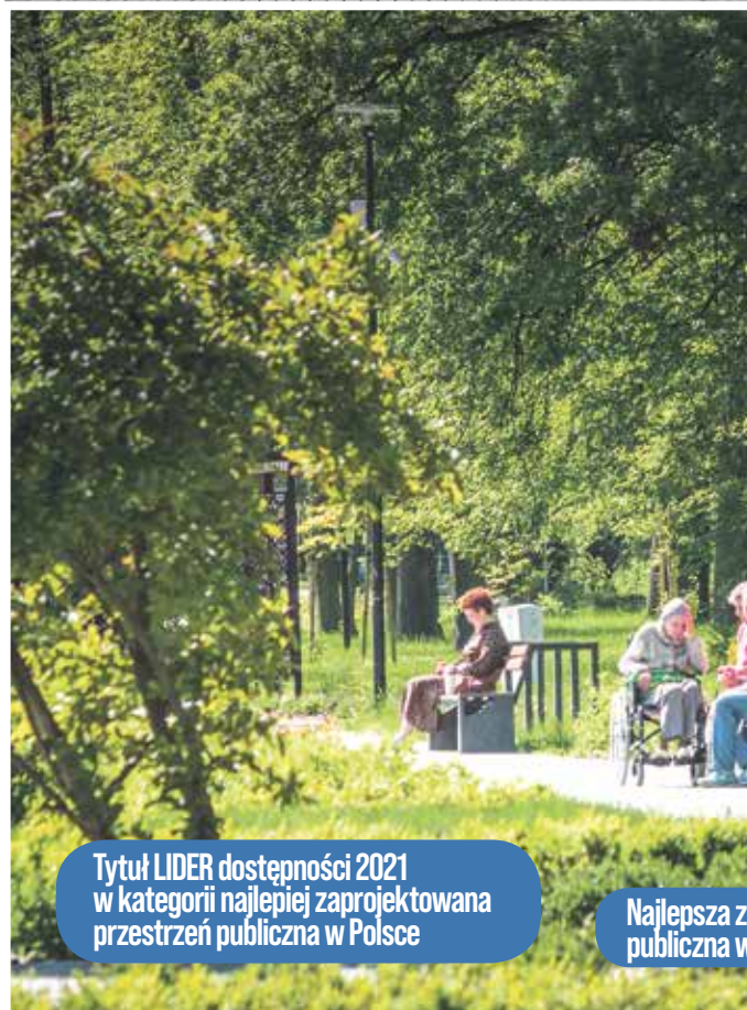
Tytuł LIDER dostępności 2021 w kategorii najlepiej zaprojektowana przestrzeń publiczna w Polsce