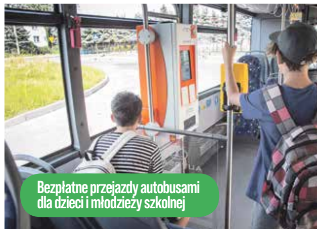
Bezpłatne przejazdy autobusami dla dzieci i młodzieży szkolnej