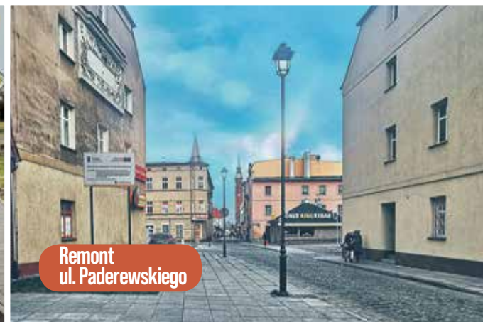
Remont ul. Paderewskiego