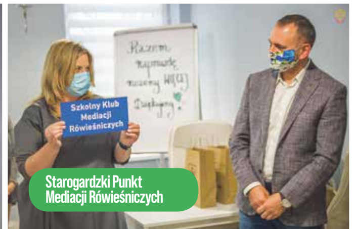
Starogardzki Punkt Mediacji Rówieśniczych