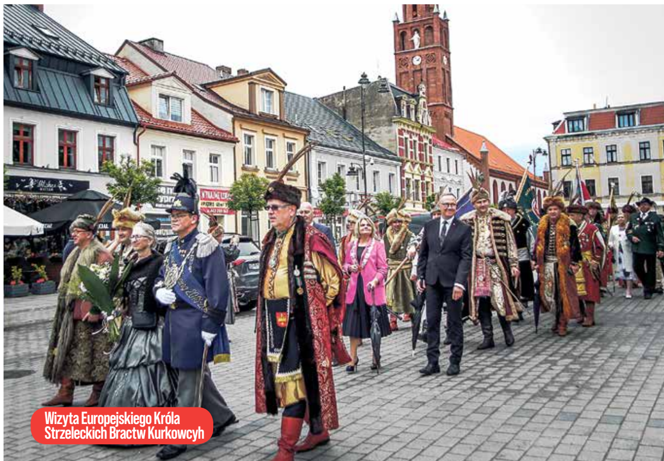
Wizyta Europejskiego Króla Strzeleckich Bractw Kurkowcyh