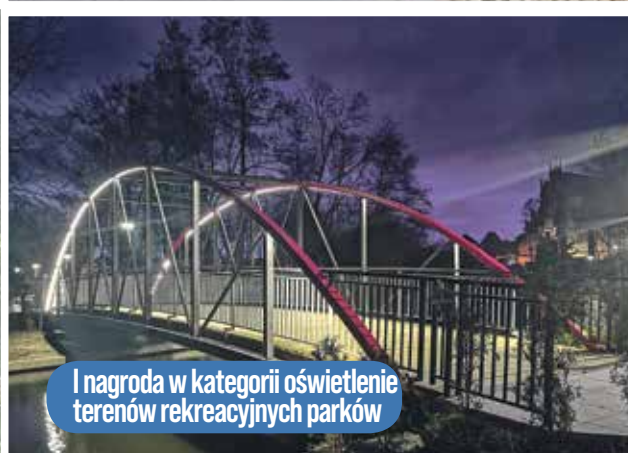
I nagroda w kategorii oświetlenie terenów rekreacyjnych parków