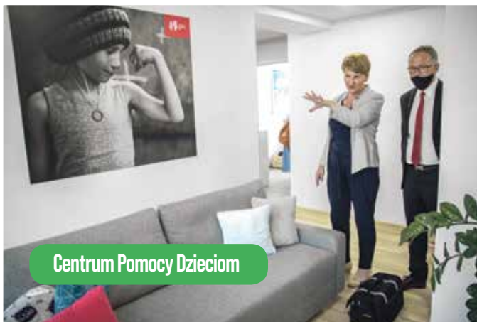
Centrum Pomocy Dzieciom