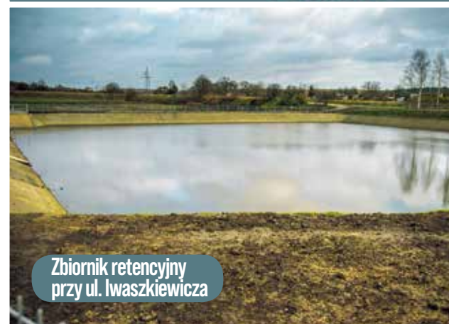
Zbiornik retencyjny przy ul. Iwaszkiewicza