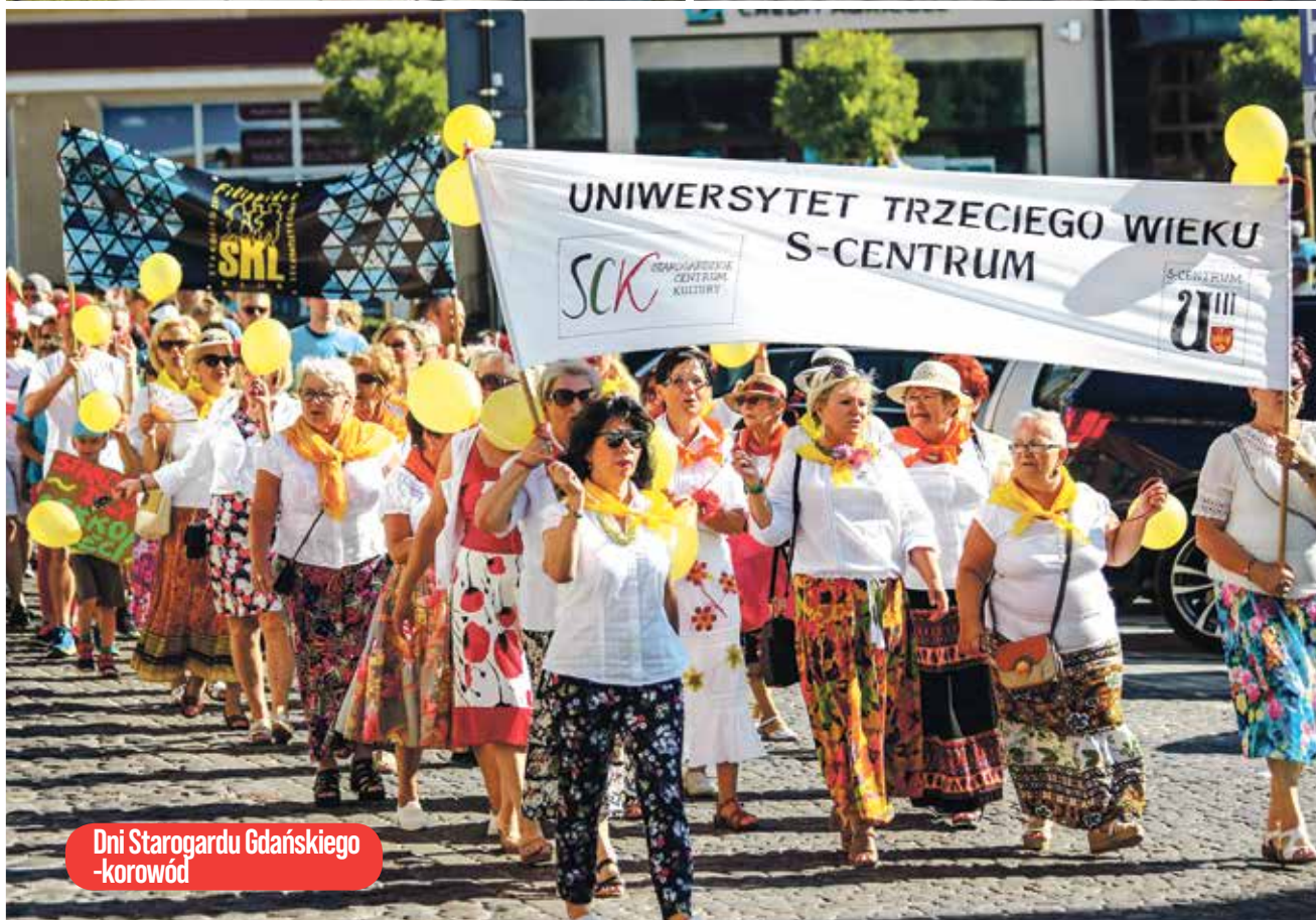
Dni Starogardu Gdańskiego - korowód