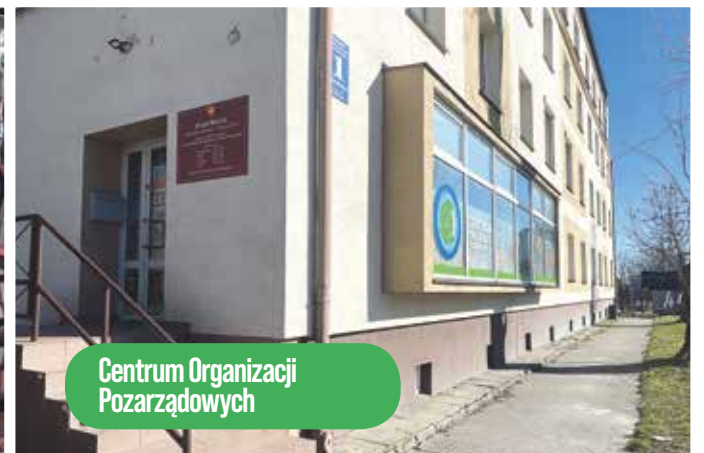
Centrum Organizacji Pozarządowych