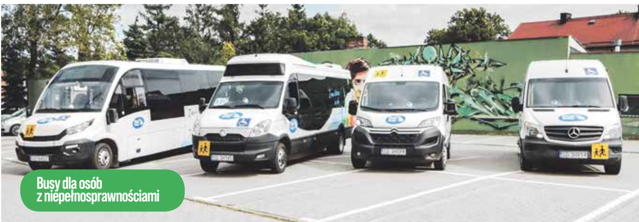
Busy dla osób z niepełnosprawnościami