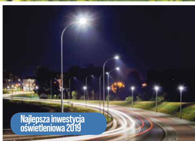
Najlepsza inwestycja oświetleniowa 2019