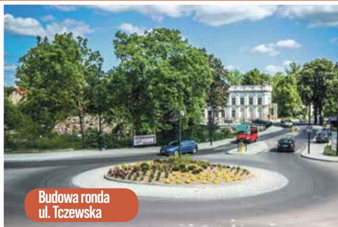
Budowa ronda ul. Tczewska