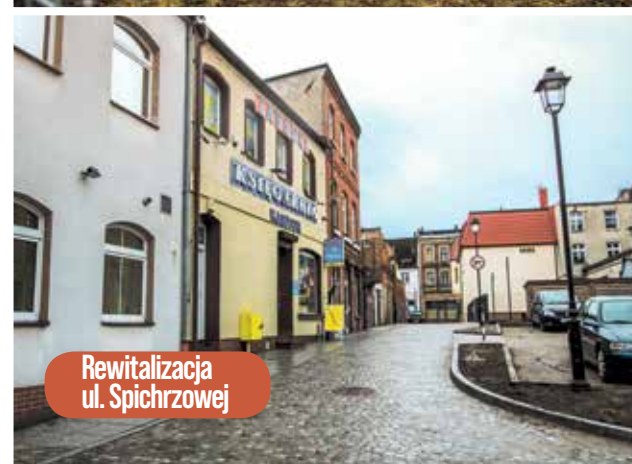
Rewitalizacja ul. Spichrzowej