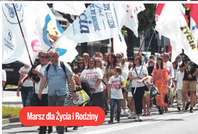
Marsz dla Życia i Rodziny