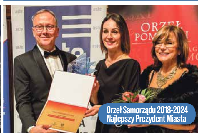
Orzeł Samorządu 2018-2024 Najlepszy Prezydent Miasta