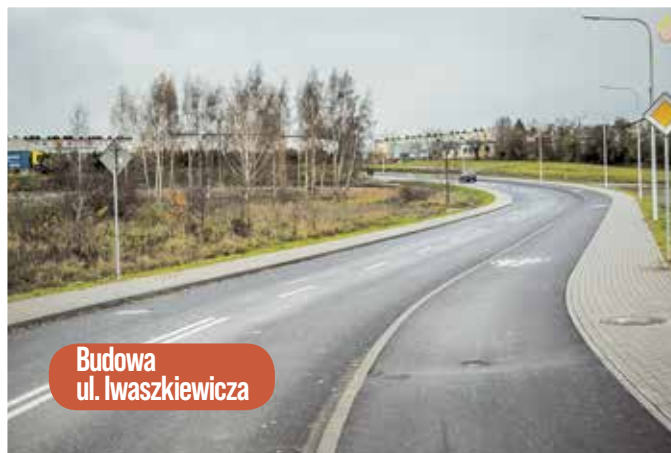
Budowa ul. Iwaszkiewicza