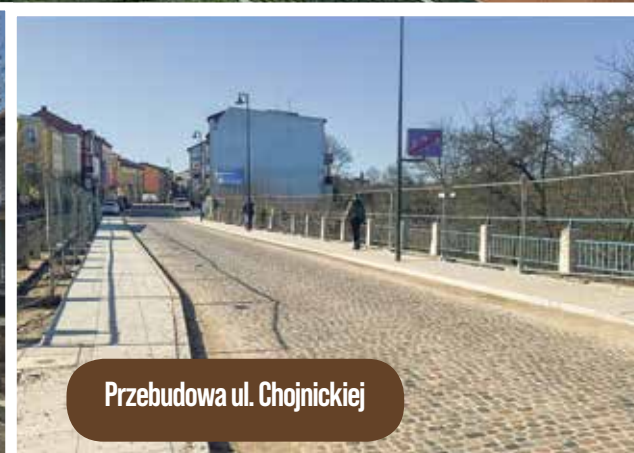
Przebudowa ul. Chojnickiej