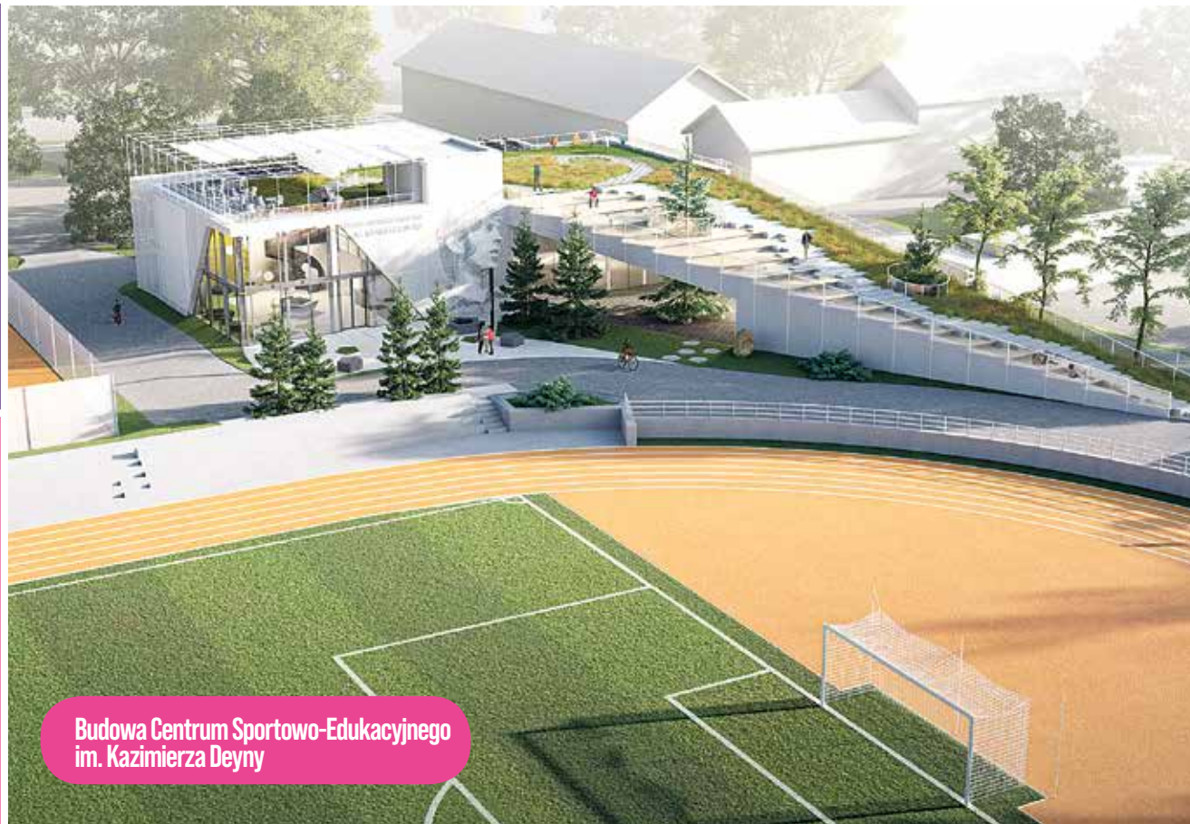
Budowa Centrum Sportowo-Edukacyjnego im. Kazimierza Deyny

Przebudowa ulic Chojnickiej, Szwoleżerów i Chopina