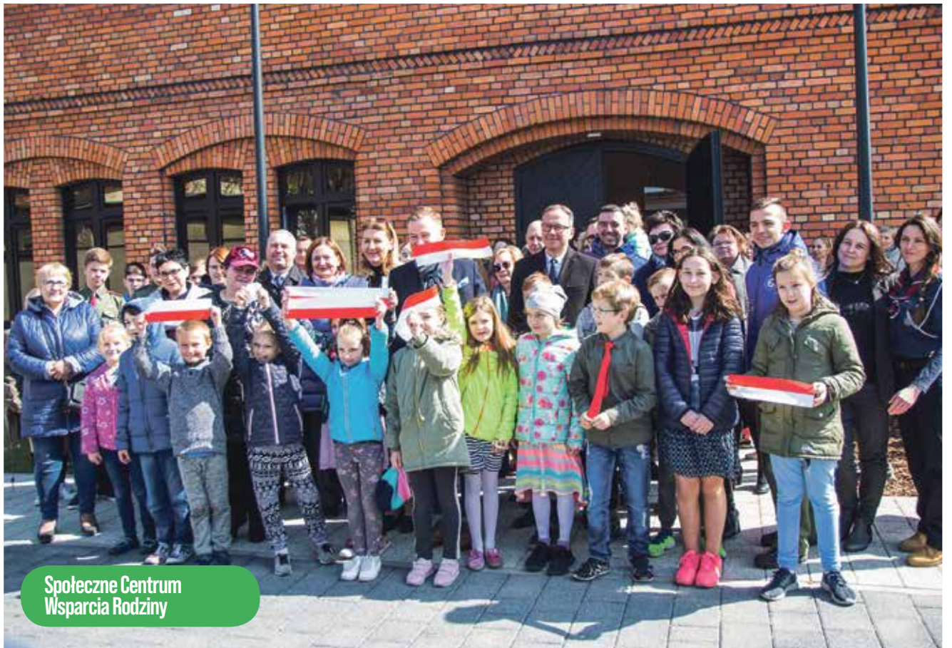
Spółeczne Centrum Wsparcia Rodziny