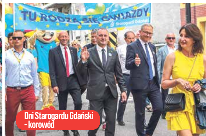
Dni Starogardu Gdańskiego - korowód