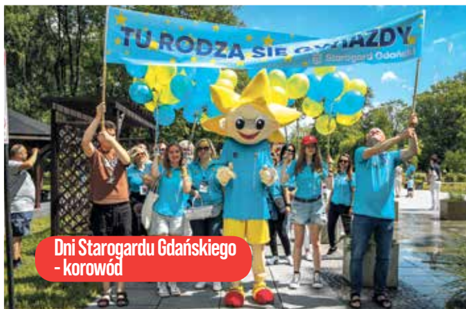
Dni Starogardu Gdańskiego - korowód