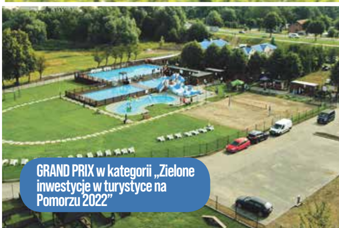
GRAND PRIX w kategorii „Zielone inwestycje w turystyce na Pomorzu 2022”