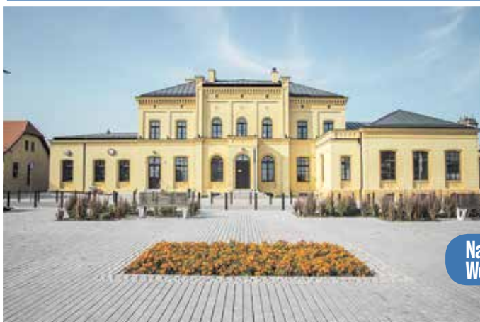
Najlepsza Przestrzeń Publiczna Województwa Pomorskiego