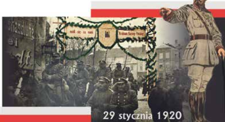
29 stycznia 1920