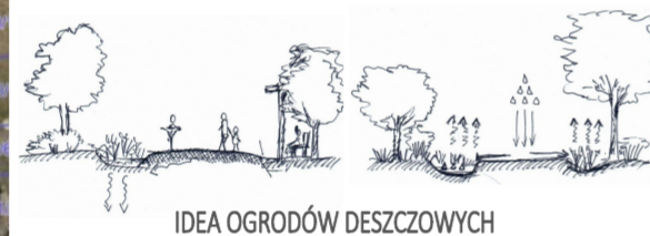
IDEA OGRODÓW DESZCZOWYCH