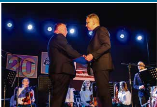
19.06 20-lecie Orkiestry Kameralnej Pro Simfonica