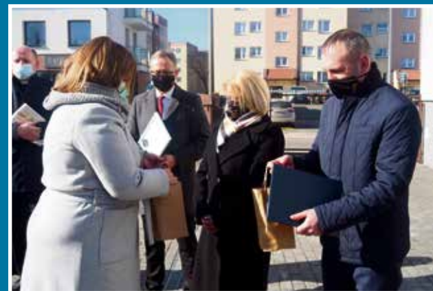
18.03 Samochód dla Środowiskowego Domu Samopomocy