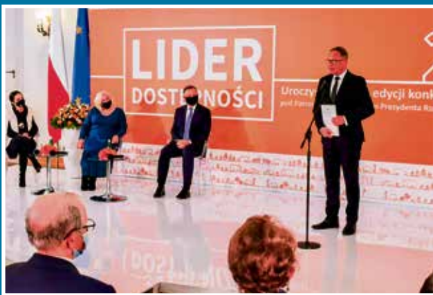
13.10 Park Miejski Liderem Dostępności