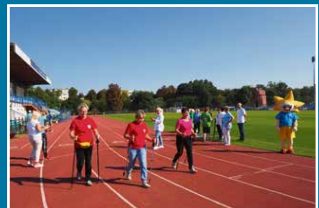
11.09 XVI Spartakiada PZERil