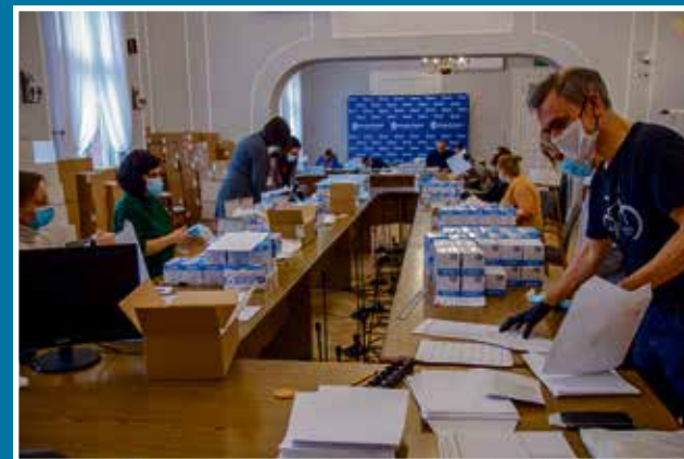
10.03 „Zamaskowani” znowu w akcji