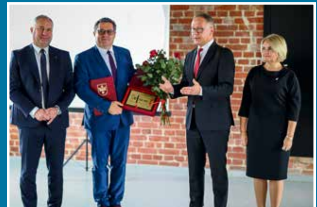
03.09 50-lecie Miejskiego Zakładu Komunikacji