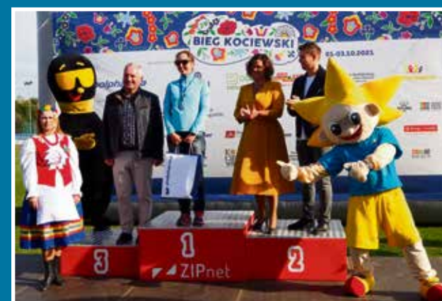
03.10 29. Bieg Kociewski z Polpharmą