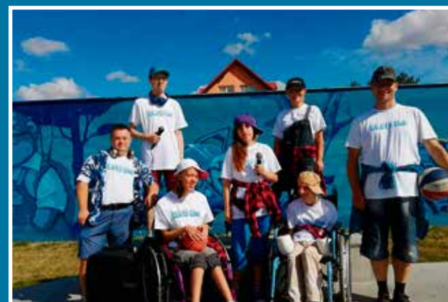
15.03 Płyta Blue MC