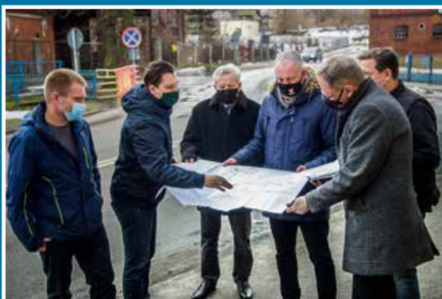
26.02 Przekazanie placu budowy ul. Tczewska-Kanałowa-Sobieskiego