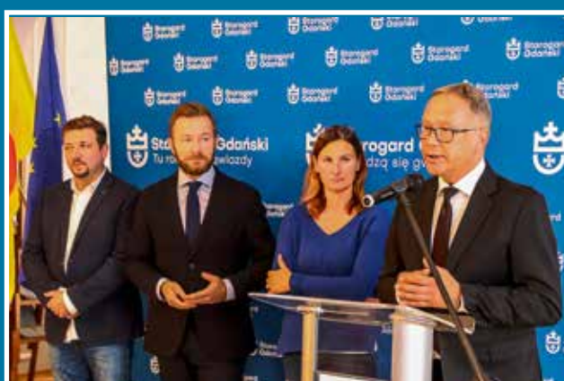
18.10 Rondo zamiast skrzyżowania DW 222 z ul. Pomorską - konferencja prasowa