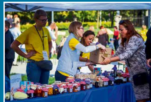
26.09 III Piknik „Kociewiaci dla Hospicjum”