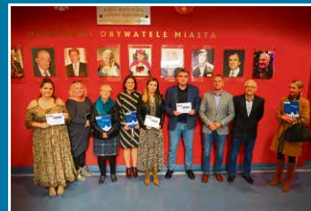
13.10 BO 2022 - poznaliśmy zwyciężców