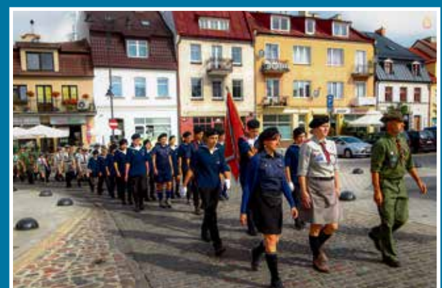
10-11 09 Harcerski Weekend z okazji 100-lecia powołanie I drużyny