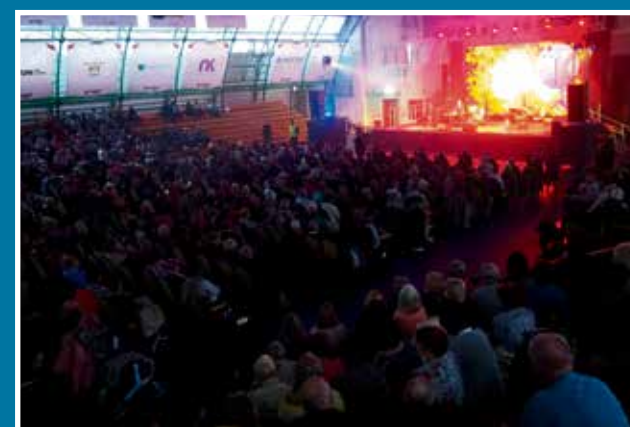
22.10 Starogardzki Dzień Seniora