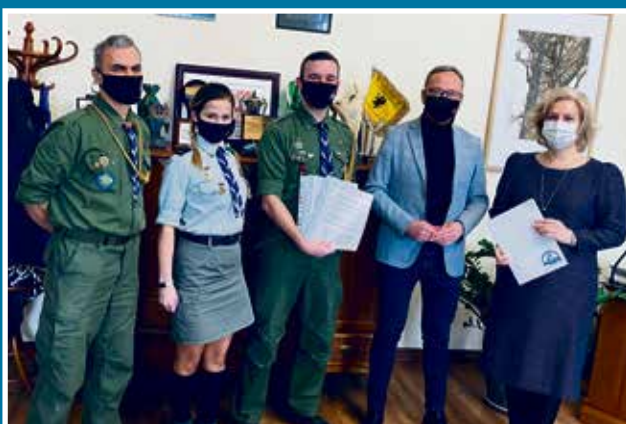
08.02 Stacja Starogard - podpisanie umowy