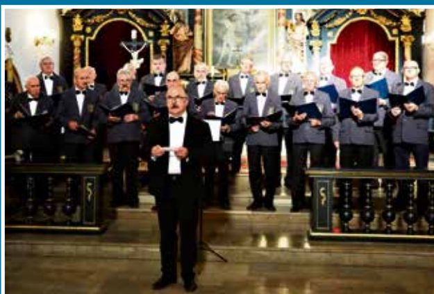
08.08 95-lecie Męskiego Chóru przy parafii św. Mateusza