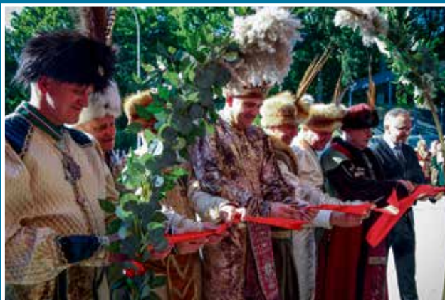
18.06 Otwarcie Strzelnicy