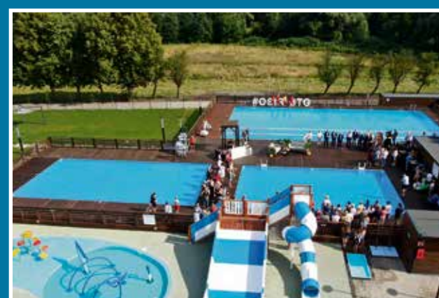
15.07 Otwarcie basenów letnich