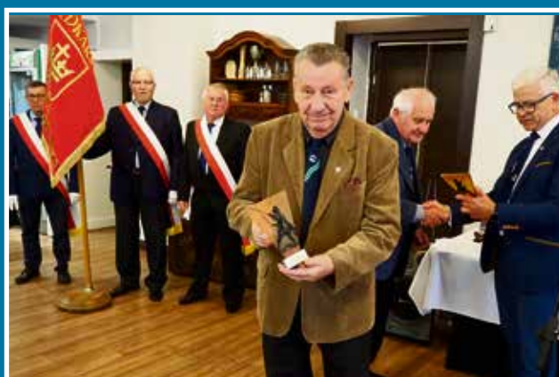
24.09 75-lecie PZW Koło nr 69 Starogard Gdański