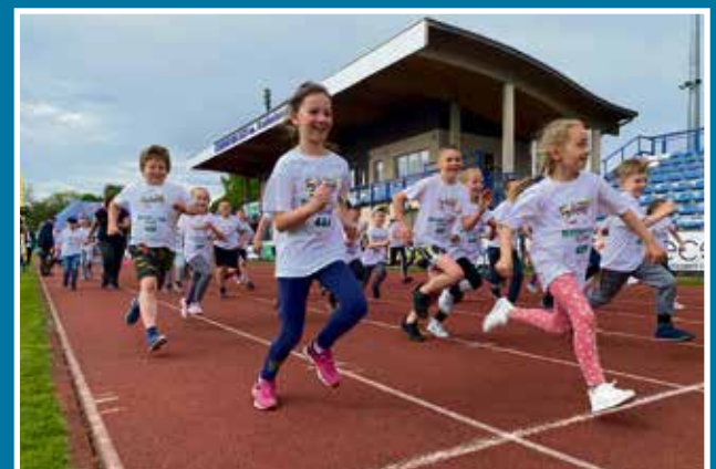
31.05 37. Bieg Szpęgawski z OLA i 01.06 Kaliska dla dzieci