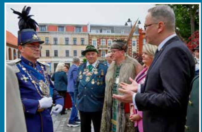
12-13 Weekend z Bractwem Kurkowym. Ćwierćwiecze Okręgu Pomorskiego