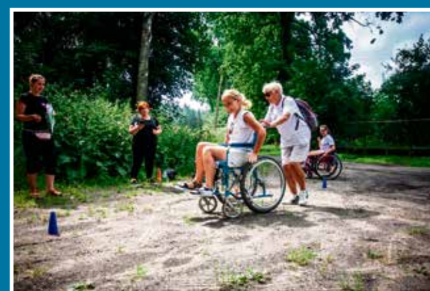
17.07 „Orientuj się” - Integracyjny Bieg Stowarzyszenia START-On