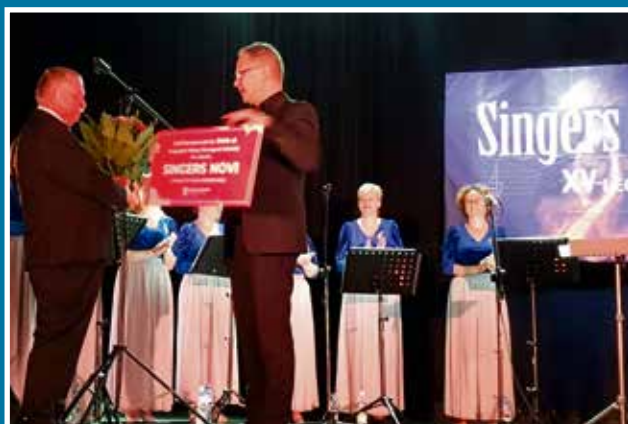
19.09 15-lecie Singers Novi