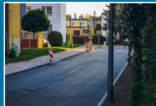
11.10 Zmodernizowana ul. Szumana