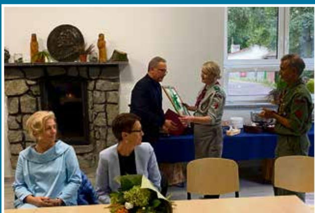
21.09 Otwarcie Stanicy ZHP po remoncie