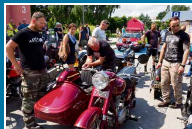
24.07 XI Zlot Weteranów Szos