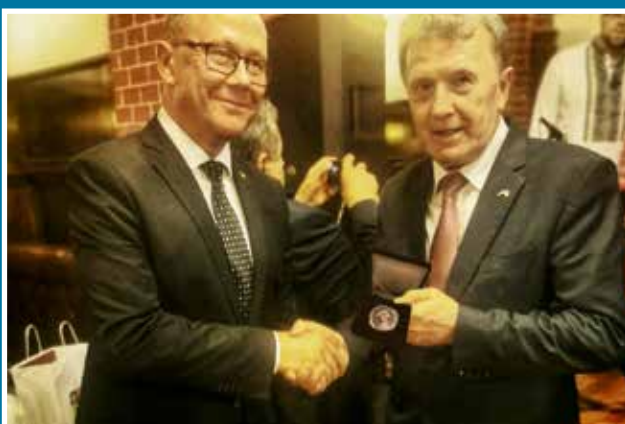
20.08 Medal 30-lecia Odzyskania Niepodległości Ukrainy