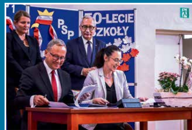
22.10 Sala sportowa PSP 8 - podpisanie umowy

W celu uzyskania informacji należy kontaktować się z pracownikami Urzędu w ustalonych godzinach pracy za pomocą poczty elektronicznej lub telefonicznie. Numery telefonów dostępne są na stronach Biuletynu Informacji Publicznej https://bip.starogard.pl/ ■