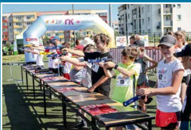
20.06 III LaserRun