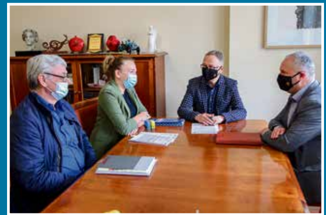
28.05 Podpisanie umowy na kanalizację ul. Rebelki i Rolnej