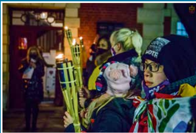
31.01 29. Finał Wielkiej Orkiestry Świątecznej Pomocy