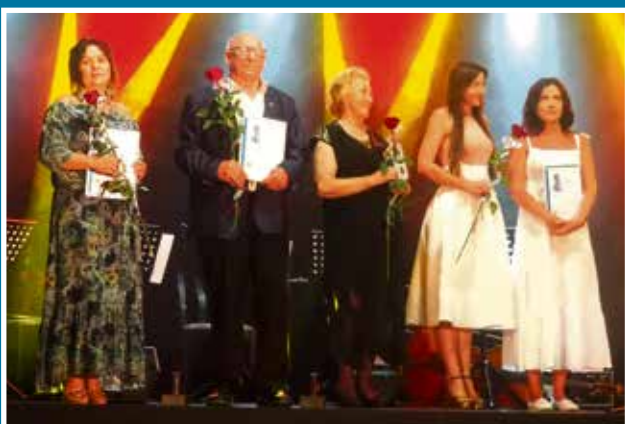
20.06 Wierzyżanki 2020