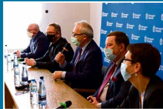
09.04 Konferencja prasowa w sprawie budowy obwodnicy