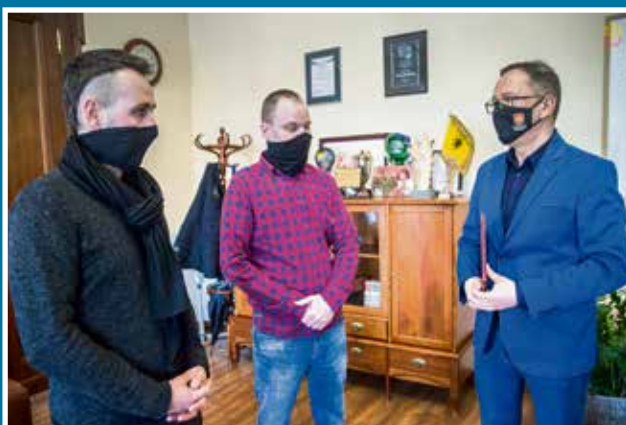
05.02 Uratowali tonące dziecko