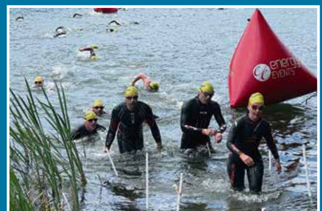
13.06 Lotto Triathlon Energy