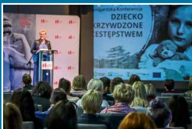
24.09 Ogólnopolska Konferencja „Dziecko pokrzywdzone przestępstwem”