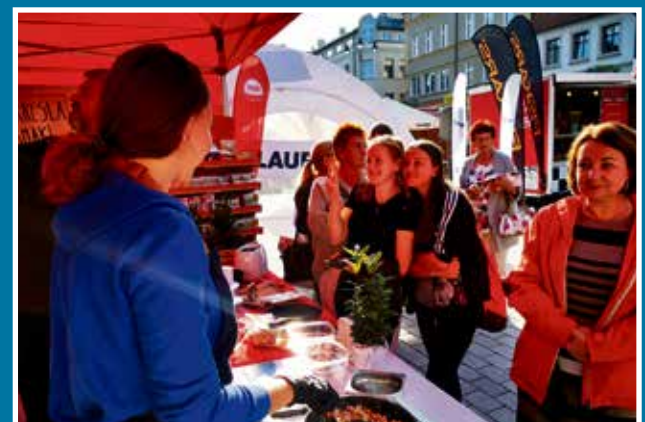
09.09 Śniadanie z Radiem Zet