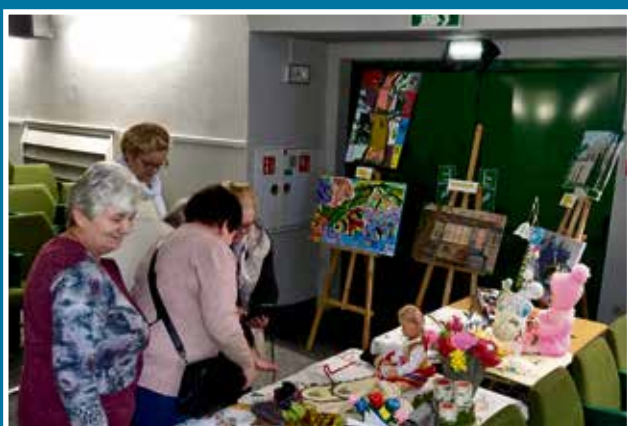
16.10 XXIV Powiatowy Przegląd Twórczości Artystycznej „Spotkajmy się”