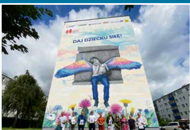
11.08 Mural na 30-lecie Fundacji „Dajemy Dzieciom Siłę”