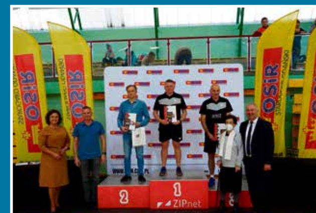
24.10 XXV Międzynarodowy Turniej Tenisa Stołowego im. A. Grubby z ASIST - XVI Memoriał