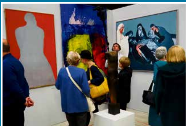
15.10 Wernisaż wystawy „Postać w sztuce zapisana” z cyklu „Sztuka Polska”