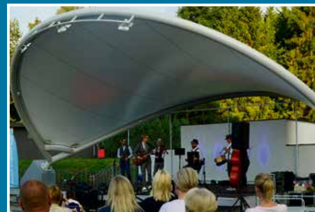
10.07 Inauguracja Sceny Letniej