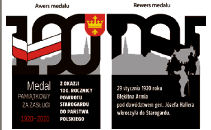
Kolejne medale na 100-lecie