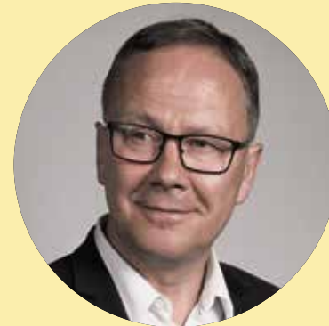
Prezydent Miasta Starogard Gdański Janusz Stankowiak

– Medale za zasługi z okazji 100. rocznicy powrotu Starogardu do Państwa Polskiego to wyjątkowe wyróżnienie, przyznawane tym, którzy w sposób szczególny przyczynili lub wciąż przyczyniają się do rozwoju „naszej małej Ojczyzny”. Są to osoby działające na różnych polach, spełniające się w często odległych od siebie dziedzinach. Łączy je jedno – zawsze dają z siebie 100%. We wszystko, co robią wkładają całe swoje serca i dusze