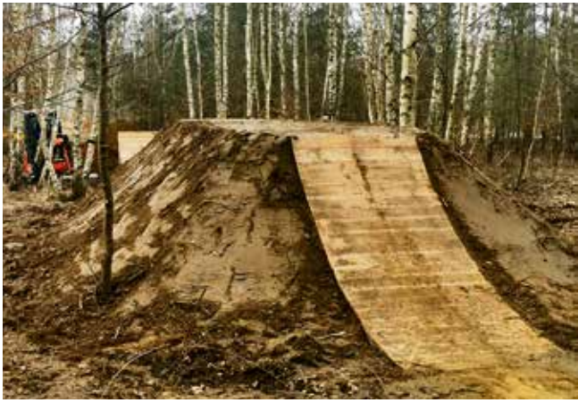
Tor dla BMX